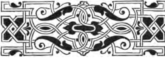
TABLE DES MATIÈRES